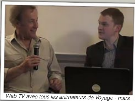
Web TV avec tous les animateurs de Voyage - mars