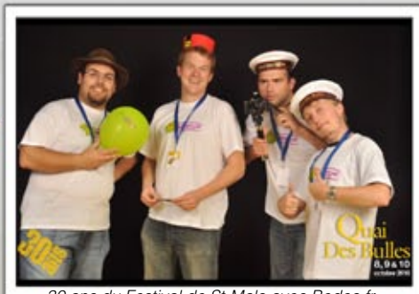
30 ans du Festival de St-Malo avec Bedeo.fr