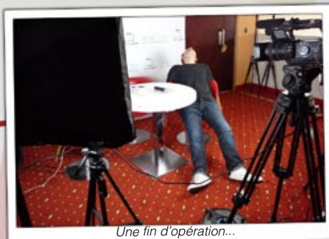
Une fin d'opération...