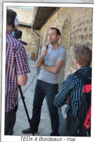
TEDx à Bordeaux - mai