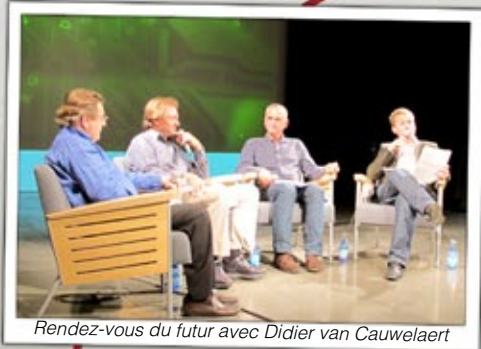
Rendez-vous du futur avec Didier van Cauwelaert