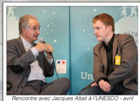
Rencontre avec Jacques Attali à l'UNESCO - avril