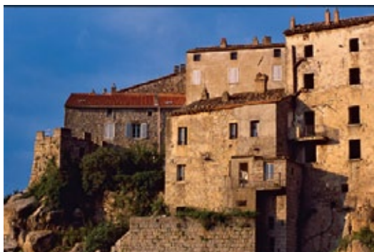
© Paysage de Corse, de Jean Harixcalde

Le catalogue est extrêmement riche. Nous y retrouvons des trésors : livres magnifiques,