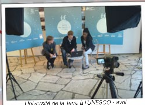
Université de la Terre à l'UNESCO - avril