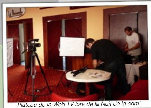
Plateau de la Web TV lors de la Nuit de la com'