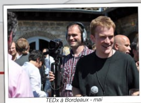
TEDx à Bordeaux - mai