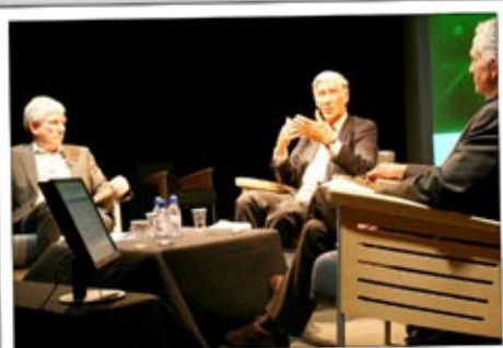
Rendez-vous du Futur au Cube tous les deux mois