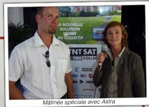
Matinée spéciale avec Astra