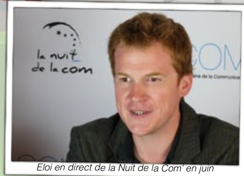
Eloi en direct de la Nuit de la Com' en juin