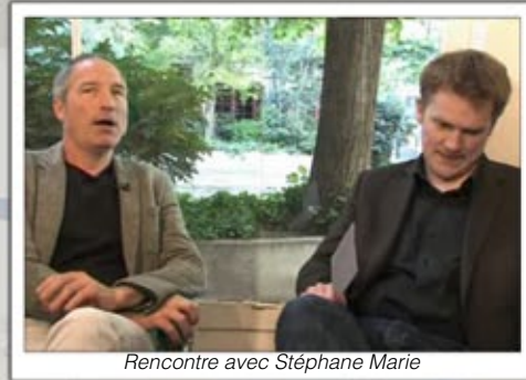
Rencontre avec Stéphane Marie