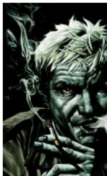
John Constantine, comic-book Hellblazer - TM & © 2009 DC Comics.

Chez Triple C, c'est Clémence qui est la rédactrice en chef. En peu de temps, elle a su mobiliser une équipe de spécialistes. Elle est devenue incollable sur les faits divers les plus marquants de l'histoire, les grands procès, les super héros de la galaxie SF ou encore les dernières actus